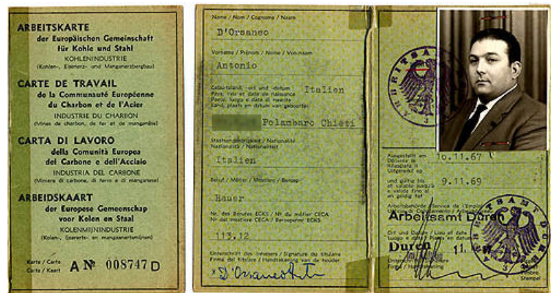
Arbeitskarte Umschlag/Innenteil (1967)

Nach dem Weihnachtsfest haben wir angefangen, in einem neuen Revier zu arbeiten, in 700 Metern Tiefe. Die zweite Gruppe Arbeiter aus Italien kam am 5. Januar 1956. Sie mussten die Art lernen untertage zu arbeiten. In Italien ist man zwar an warmes Klima gewöhnt, doch die Hitze unter Tage ist anders. Drei von uns Erstangekommenen wurden als Vorarbeiter und Dolmetscher für die Neuangekommenen eingesetzt. Die deutschen Kumpel haben zu ihrem Spaß ein Schild gemacht "Revier III a - Itaker-Revier".