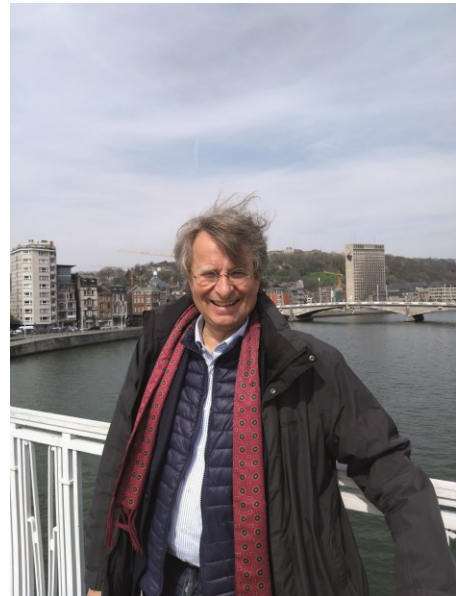
Olaf Müller Foto: privat